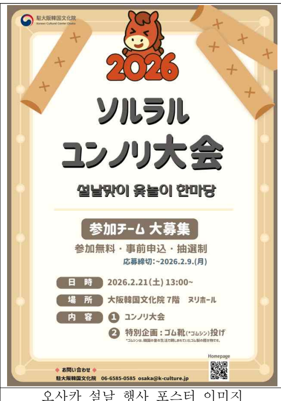
오사카 설날 행사 포스터 이미지