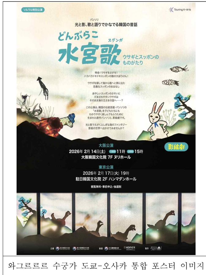
와그르르 수궁가 도쿄-오사카 통합 포스터 이미지