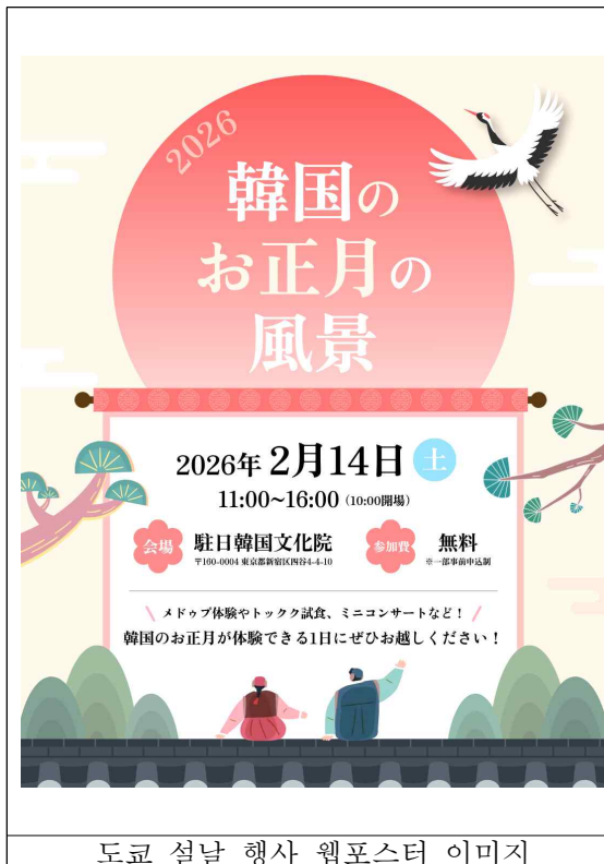
도쿄 설날 행사 웹포스터 이미지